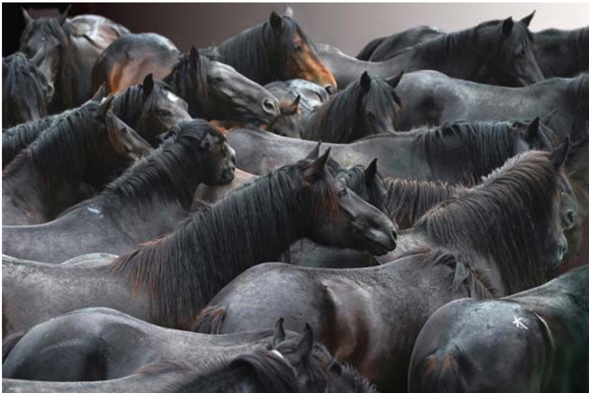
La transhumance des chevaux de Mérens a lieu chaque année au mois de juin

Nous sommes installés dans une ferme au pied des Pyrénées dans le département de l'Ariège, berceau originel de ce petit cheval noir et rustique qu'est le cheval de Mérens.